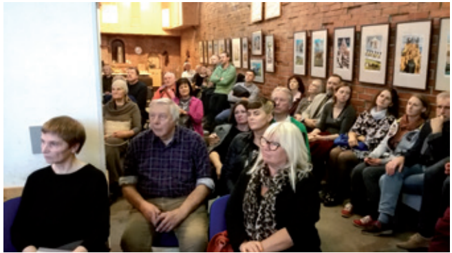
Klubo salė buvo pilnutėlė....

Vakaro metu svečiui buvo įteikta Vilniaus universiteto Chemijos ir geomokslų fakulteto Geomokslų instituto padėka, kurioje sakoma: „Vilniaus universiteto vardu