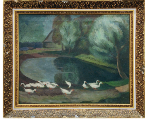
Justinas Vienožinskis. „Tvenkinys su antimis Dačiūnuose“. Drobė, aliejus. 1938 m.