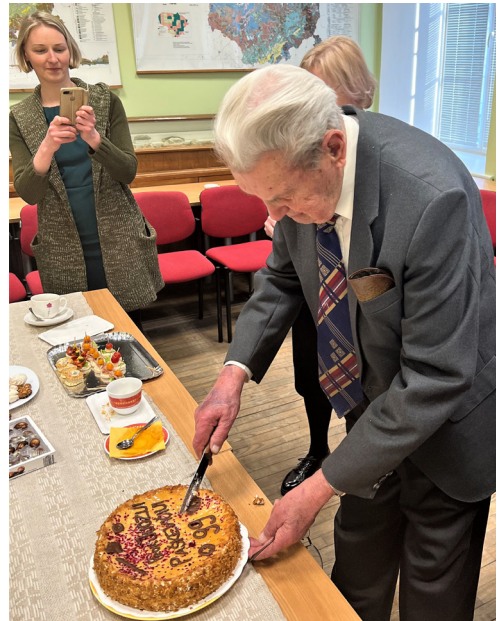
Netrukus Profesorius sveičiams dalins šventinį tortą, 2023 m. kovo 17 d.