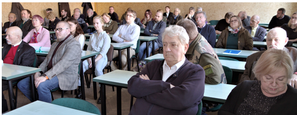
Norintys pasveikinti Profesorių vos tilpo Didžiojoje auditorijoje, 2023 m. kovo 17 d. Those who wished to congratulate the Professor barely fit in the Great Auditorium, the 17 March, 2023