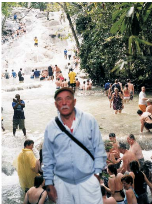
Jamaikos botanikos sodo ilgieji kriokliai. Jamaican Botanical Garden falls.

venamuosius namus ir kitų išlikusių griuvėsių paskirtį. Po to galėjome dar valandą fotografuoti arba, nusileidę patogiais laipteliais nuo apie 50 m aukščio klinčių uolos prie jūros, pasimaudyti nuostabiame paplūdimyje. Šiuolaikinio Tulum aikštėje pastatyti keli nauji viešbučiai, kavinės, kur apsigyvena ilgesniam laikui atvykę turistai. Atėję prie savo autobuso, iš gidų gavome šiltų bandelių su kumpiu ir po buteliuką gavinančio gėrimo. Daugiau kaip valandą važiuojome į Cozumel uostą, kur kateris mus nuplukdė į mūsų milžinišką dvylikos aukštų laivą, kurio kajutėse gali gyventi 2720 keleivių. Išsilaiipinant į kiekvieną ekskursiją laivo vadovybė mums primindavo – moterims ir vyrams papuošalus palikti kajutės seifuose, kad krante išvengtume vagysčių ir apiplėšimų. Dalis laivo keleivių, ypač su mažais vaikais, pasilikdavo laive, kur jiems buvo rengiami įvairūs atrakcionai, sportiniai žaidimai, maudynės baseinuose ir kt. Sugrįžus iš ekskursijos laive vykdavo koncertai, teatro spektakliai ir net nemokamos šokių pamokos, o norintiems pasimankštinti – erdvios treniruoklių salės, žaidimas mini krepšinio, teniso ar tinklinio aikštelėse.