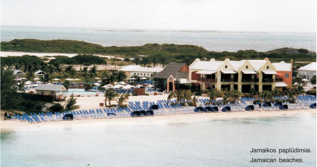
Jamaikos paplūdimiai. Jamaican beaches.

niais pabūklais, atvežtais ispano Kristupo Kolumbo, jam čia apsilankius 1492 m.