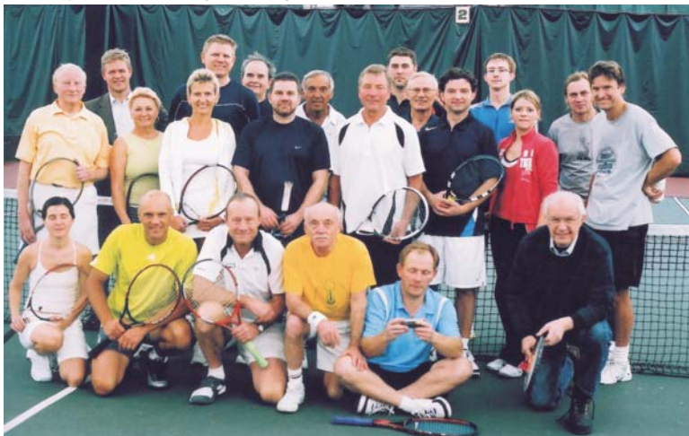
Čikagos lietuvių teniso klubo varžybų dalyviai.

Poilsiaujant ir dirbant dienos Čikagoje bėgo nepaprastai greitai. Buvau nustebintas Čikagos Dauntone dygstančių dangoraižių gausa, Mičigano ežero pakrančių gražiu sutvarkymu, senų dviaukščių