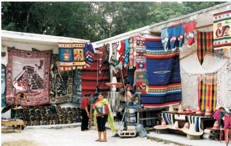
Meksikos tautodailės prekybos vietė.

Atvykus į Tulum majų gyvenvietę, beveik du kilometrus ėjome pėstute iki vartų 3 m aukščio mūrinėje tvoroje, kuri saugojo senąją gyvenvietę. Beveik keturias valandas du gidai vedžiojo pasakodami apie šventyklas, piramides, gy-