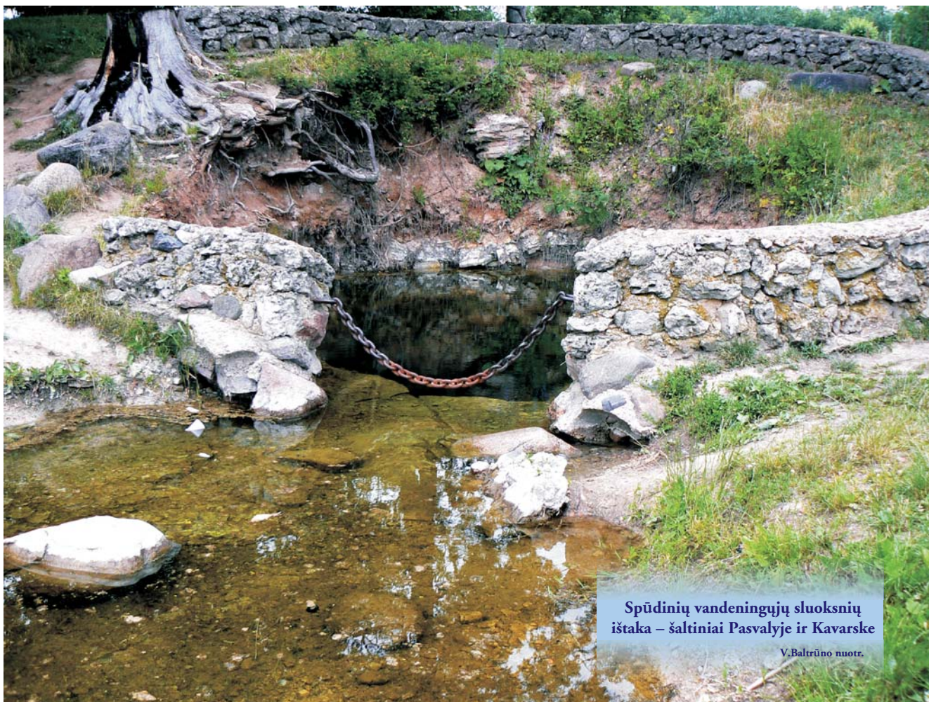
Spūdinių vandeningųjų sluoksnių ištaka – šaltiniai Pasvalyje ir Kavarske